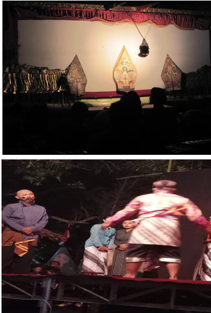
Gambar 1.10 wayang kulit Lan Seni Ketoprak.

Seni lan budaya ingkang misuwur ing wewengkon Semugih inggih punika seni tradisional reog, jathilan, kethoprak, Karawitan, ugi wayang kulit lan Srandul.