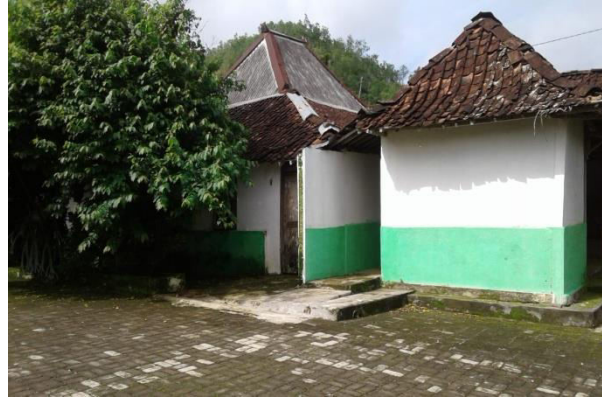
Gambar 1.6 Griya Joglo lan Kampung.

Warga taksih nglestantunaken griya kuno joglo, limasan, kampung saking warisan jaman rumiyin. Kajeng ingkang dipun ginaaken damel griya kasebat Kajeng Jati .