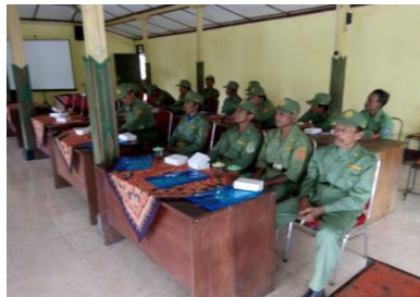
Gambar 3.7 Pembinaan Perlindungan Masyarakat ( Linmas )

Sarana kanggo nindaaken katentreman warga, damel Pos kamling kangge rondha, warga sami nindakaken rondha ing pos asring ngawontenaken thoklik, seserepan ngengingi ketrentreman lan ketertiban awit wontenipun babinsa menika petugas saking Koramil, Babinkamtibmas petugas saking Polsek ingkang ingkang dipun tugasaken ing desa Semugih. Mekaripun Pos Kamling Ugi Ketingal katitik Cacahipun setunggal Desa wonten 53 Papan saenggo saben Rukun Warga ( RT ) gadah Pos Kamling Piyambak piyambak. Saking Paprentahan Desa ugi wonten Pembinaan Perlindungan Masyarakat ( Linmas ) lan bantuan sarana orasarana kangge Linmas, cacahipun Linmas desa Semugih wonten 41 tiang,