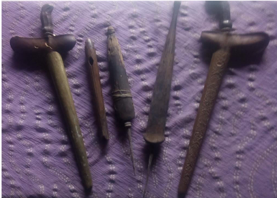
Gambar 1.12 Keris lan tumbak.

Pusaka minangka sipat kandel para leluhur ingkang taksih karukti dumugi jaman sapunika antawisipun Tumbak, Pedang, Pusaka Keris. Kanyata ing saben wulan Sura dipun jamasi supados kawontenan pusaka kajagi pamoripun. Tradisi punika saking para Empu lan poro winasis jaman rumiyin, wondene tatacaranipun kanthi uba rampe toya krambil, jeruk, warangan.