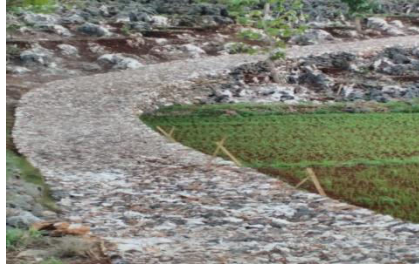
Gambar 3.2 Jalan Usaha Tani (JUT)

2. Sarana kesehatan Desa Semugih Dokter Praktek wonten 2 mapan Padukuhan Karangwetan lan Baran kulon. Posyandu wonten 13 saben Padukuhan, saha Bidan Praktek Mandiri (BPM) ngladosi warga masyarakat ingkang nglairaken wonten 2 mapan ing Padukuhan Baran kulon lan Bendorubuh. Puskesmas Rongkop sandyan mapan wonten Desa Karangwuni nanging wonten ing sak tengah tengahing Desa Semugih. Apotik Wonten 2 Mapan ing Padukuhan Kerdomiri lan Baran Wetan. Perilaku Hidup Bersih dan Sehat (PHBS), masyarakat Ugi lumampah. Padukuhan Bebas asap rokok Karangwetan lan Semugih minangka uji coba saking UPT Puskesmas Rongkop. Desa Semugih sampun nindaken babagan menika ugi, pramila dipun bentuk Desa Siaga Ing taun 2012, Wonten Kegiatan Green and Klien babagan resesik lan pemilahan Sampah kanyata Padukuhan Baran Kulon pikantuk Juara Tingkat Kabupaten. Babagan sosial kemasyarakatan kegiatanipun mbiyantu ngrampungaken Penyandang Masalah Kesejahteraan Sosial (PMKS), warga pados Kartu jaminan kesehatan (KIS, JAMKESTA), nglantaraken alat bantu kagem warga disabilitas, saha pelatihan kaprigelan disabilitas. Kegiatan ingkang katindakaken: Program Keluarga Harapan (PKH), bantuan stimulan Jamban sehat.