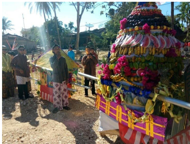
Gambar 1.9 kirab budaya lan gunungan .