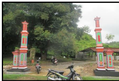
Gambar 3.9 Gapura kabangun ing Program PLPBK

Paprintahan Semugih ingkang Makarya sareng Kaliyan BKM Madiri ingkang saget meraihi Bejana ( Reward ) Saking Pemerintah Pusat ingkang awujud Program Noto Deso ( ND ) kanthi bukti ingkang sampun kaleksanan Pembangunan fisik Babagan Penataan Lingkungan Pemukiman Berbasis Komunitas, kados dene Tugu/ Gapura PLPBK, Kandang Komunal, Show Room, Gedung dan Mesin Pengolahan Kasava/ Mokav. Saluran Air, Pembangunan Talud, Sanitasi Terpadu lan Pembangunan Jamban Keluarga lan Tugu PLPBK.