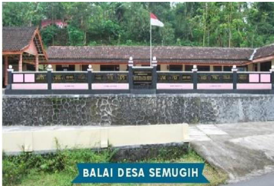
Gambar 3.1 Kantor desa Semugih