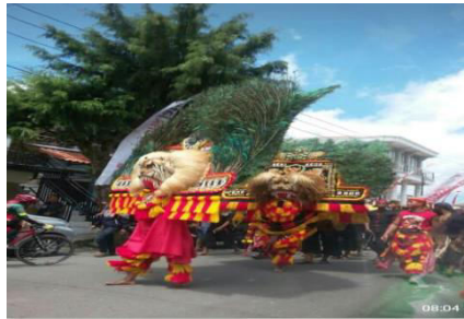
Gambar 3.4 Festival Reog Ponorogo

Upacara adat ingkang lumampah ing Desa Semugih nglestantunaken ingkang katindakaen jaman rumiya dening masyarakat saha sakmenika perkawis menika kalampah upacara adat Rasulan ingkang juru kuncinipun saben Padukuhan nggadahi Jurukunci piyambak piyambak Jinising upacara adat : Rasul, gumbrekan, tingkepan. Babagan seni budaya ingkang wonten, Kethoprak, wayang kulit, beksan, jathilan, reog, karawitan, campur sari, rebana, gejok lesung. Desa Semugih ingkang nindakaken nglestantunaken tradisi lan budaya ingkang dipun dampingi saking dinas kebudayaan lan dewan kebudayaan kabupaten Gunungkidul lan ugi propinsi Daerah Istimewa Yogyakarta. Menggah ingkang dados kridha laksana/ kegiatan minangka Desa Rintisan Budaya , kegiatanipun gelar Lan Pentas Seni tahun 2012, mapan ing Lingkungan Gedung Kasava. Iaminipun 3 dinten 3 dalu Sedaya Seni ingkang wonten ing Desa Semugih saget andil wonten ing Kegiatan menika ngiras pantes ngresmekaken Gedung Pengolahan Mokav lan Kasava Dening Bupati Gunungkidul, rikala semanten ugi karawuhan saking Dinas Pariwisata Daerah Istimewa Yogyakarta. Kiprahipun Reog Singo Duto Bantarangin saking Padukuhan Baran kulon Desa Semugih satemah dipun tunjuk Makili Kabupaten Gunungkidul Majeng nderek Fistifal Reog tingkat Nasional wonten ing Ponorogo kaping kalih majeng lomba tahun 2010 lan tahun 2012.