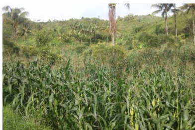
Gambar 3.7 Kebun Buah

Budidaya taneman woh-wohan ing bulak Nduren Padukuhan Purworejo makaryo kaliyan Kelompok Tani Maju Mandiri lan dipun Dampingi Saking Bappeda lan Dinas Pertaian Kabupaten Gunung Kidul pikantuk Dana saking Pusat ingkang pun sebat Pemanfaatan Lahan Kritis Sumbr Daya Air Berbasis Masyarakat ( PLKSDA-BM ) ingkang wiyaripun lahan watawis wonten 4 hektar ingkang kadadosan lahan datar lan sak perenging pegunungan woh-wohan ingkang dipun Tanem antawisipun : Jeruk, Klengkeng Srikoyo lan Sirsat. Ing sak mangke hasilipun pun bagi Kelompok Tani kaliyan Pemerintah Desa Semugih. Kelompok Tani Maju Mandiri menika salah 1 ( Setunggal ) kelompok tani ingkang sampun gadahi Badan Hukum ( BH )