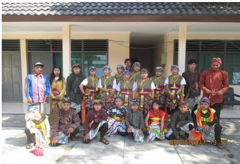
Gambar 1.11 Seni Jathilan.

Seni ingkang sesambetan kaliyan keamanan ugi sarana njagi keamanan lan katentreman lingkungan seni tradisional thek-thek kanthi ngungelaken kenthongan lan sesekaran ingkang jumbuh kaliyan kawontenan katentreman warga masyarakat. Seni tradisional sanesipun ingkang awujud sastra inggih punika geguritan, sesorah, tembang macapat ngemu raos panuntun lan paugeran gesang. Seni tradisional ingkang olah wiraga, wirama, wirasa, wirupa lumampah wujud beksan klasik punapa kreasi. Saking seni tradisi punika, nggadahi piguna tumraping gesangipun masyarakat. Seni ingkang nggegulang babagan karohanen tuladhanipun saking terbangun, sholawatan, hadroh, kekidungan, pepudyan.