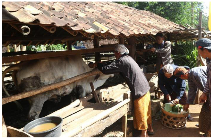
Gambar 1.7 Tradisi gumbregan

Tatacara ingkang katindaaken pinangka adat tradisi mertandhani raos syukur dumateng Pengeran kanthi wujud Kirim dongo, Gumbregan lan Rasulan. Adat gumbrekan menika katah katahipun mendet dinten Selasa wage wuku Gumbrek . warga sami damel Kopat, Jadah, lan goreng Cengkaruk ( goreng beras ) kupat lan jadah sanesipun dipun teda Warga ugi Kangge makan Raja kaya kados dene : Bebek iwen , kebo, Sapi, Menda lan sanesipun