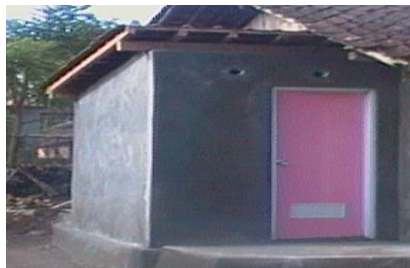
Gambar 3.3 Pembangunan Jamban Sehat

2. Sarana kesehatan Desa Semugih Dokter Praktek wonten 2 mapan Padukuhan Karangwetan lan Baran kulon. Posyandu wonten 13 saben Padukuhan, saha Bidan Praktek Mandiri (BPM) ngladosi warga masyarakat ingkang nglairaken wonten 2 mapan ing Padukuhan Baran kulon lan Bendorubuh. Puskesmas Rongkop sandyan mapan wonten Desa Karangwuni nanging wonten ing sak tengah tengahing Desa Semugih. Apotik Wonten 2 Mapan ing Padukuhan Kerdomiri lan Baran Wetan. Perilaku Hidup Bersih dan Sehat (PHBS), masyarakat Ugi lumampah. Padukuhan Bebas asap rokok Karangwetan lan Semugih minangka uji coba saking UPT Puskesmas Rongkop. Desa Semugih sampun nindaken babagan menika ugi, pramila dipun bentuk Desa Siaga Ing taun 2012, Wonten Kegiatan Green and Klien babagan resesik lan pemilahan Sampah kanyata Padukuhan Baran Kulon pikantuk Juara Tingkat Kabupaten. Babagan sosial kemasyarakatan kegiatanipun mbiyantu ngrampungaken Penyandang Masalah Kesejahteraan Sosial (PMKS), warga pados Kartu jaminan kesehatan (KIS, JAMKESTA), nglantaraken alat bantu kagem warga disabilitas, saha pelatihan kaprigelan disabilitas. Kegiatan ingkang katindakaken: Program Keluarga Harapan (PKH), bantuan stimulan Jamban sehat.