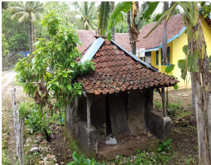
Gambar 1.15 Petilasan Maling Genthiri lan Petilasan Majapahit