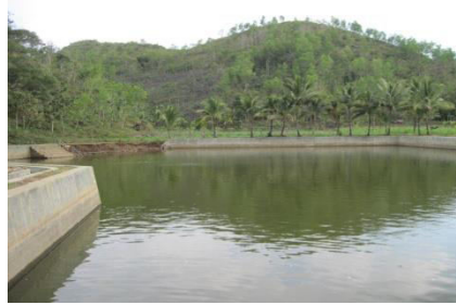
Gambar 3.6 kelompok perikanan Telaga

warga ugi damel kelompok peternakan/ Kelompok Usaha Bersama (KUBE) cacahipun wonten 25 Kelompok, lajeng Kelompok tani wonten 13 kelompok, Kandang ternak Kelompok wonten 4 kelompok inking mapan wonten ing Padukuhan Purworejo, Baran kulon, Baran Wetan Lan Bendorubuh. Kelompok perikanan Telaga wonten 3 kelompok. Inking mapan ing Padukuhan Purworejo, Kemiri lan Padukuhan Kemesu