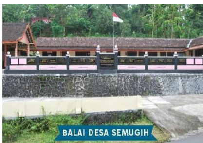
Gambar 3.1 Kantor desa Semugih

1. Sarana Pamarintahan Desa, bangunan ingkang wonten inggih menika : ruang pelayanan Umum, Sekretariat, Ruang Kepala Desa, Ruang Tamu, pendapa, sekretariat lembaga-lembaga desa, perpustakaan, Ruang Gapoktan, Ruang Desa Siaga, Ruang Arsip, Ruang Samsat, Ruang Babinsa/ Babinkamtibmas, Dapur, Kamar mandi lan Mushola.