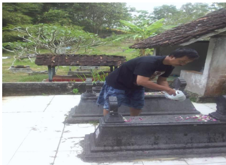
Gambar 1.8 tradisi nyekar

Tradisi sanesipun ugi wonten ziarah dateng makam leluhur pratandha asung pandonga dumateng Gusti tumrap gesangipun lan asung Pandonga ingkang sampun seda ugi ngiras pantes ngormati kaliyan para leluhur ugi para pahlawanipun